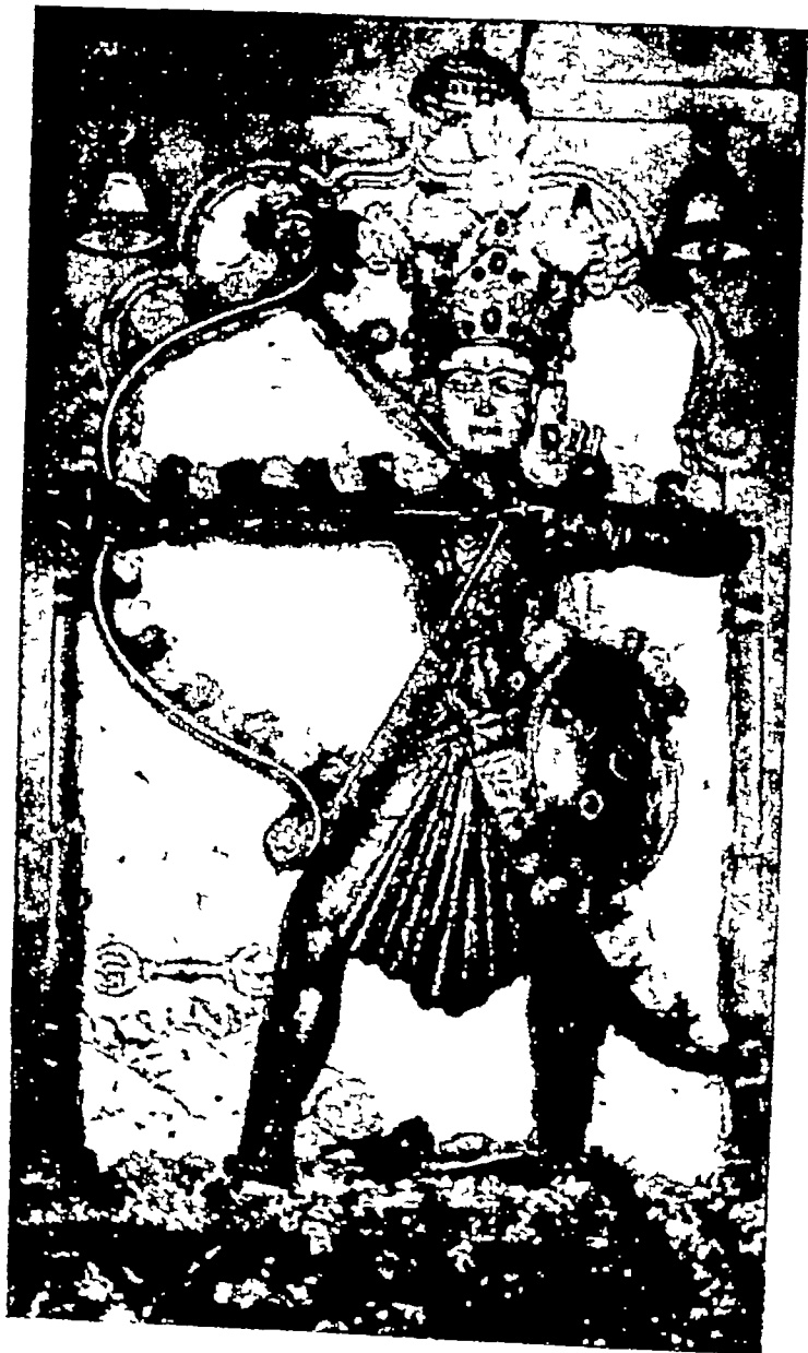
श्री घंटाकर्ण महावीर देवमूर्ति